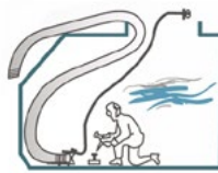
용접 Gas 제거