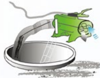
신선한 공기 공급 및 유해 Gas 제거