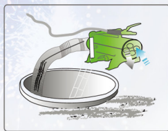
신선한 공기 공급 및 유해가스 제거